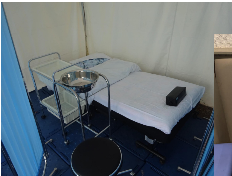
簡易ベッド等の設置