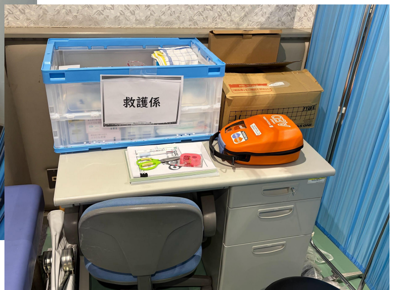
AED等救護用品の準備