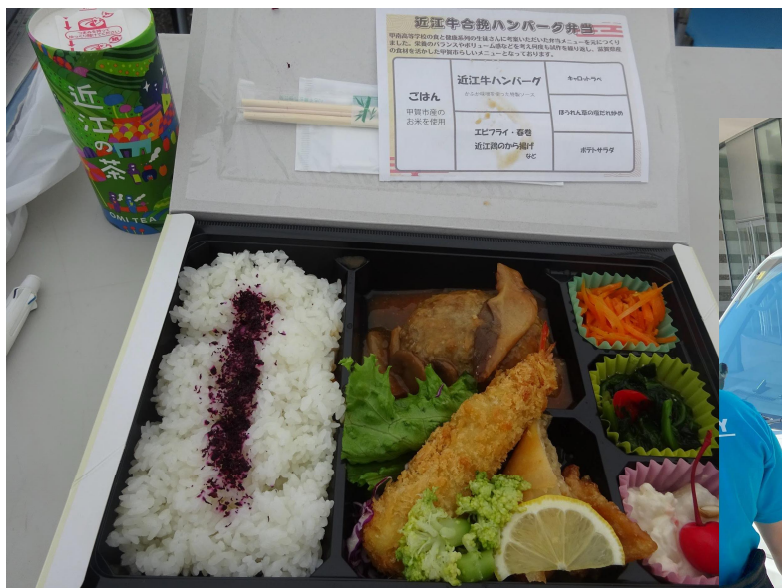
選手等に販売する斡旋弁当