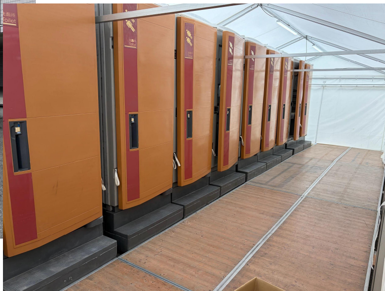
仮設トイレ（選手監督用）