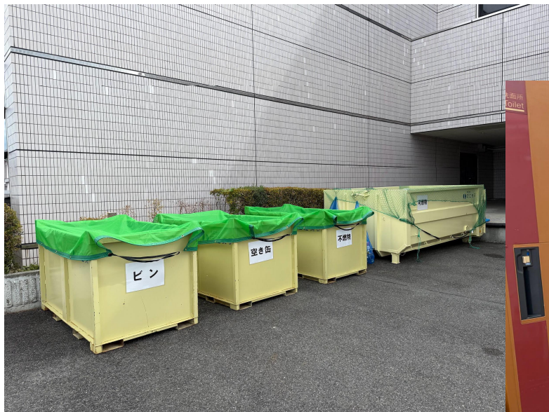
廃棄物の分別・処理