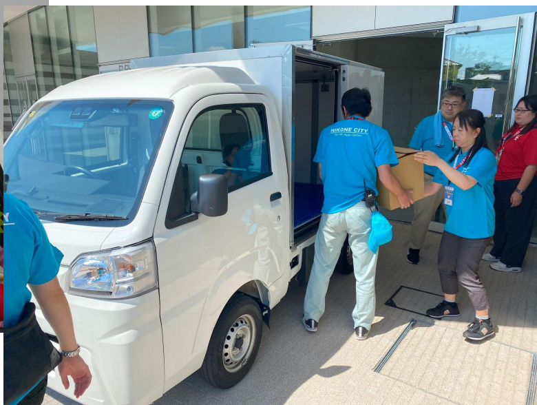
保冷車による弁当の保管