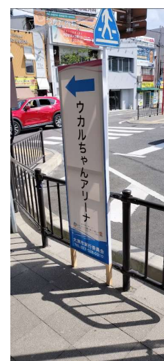
歩行者向け誘導看板