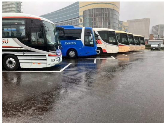
競技会場周辺のバス待機所