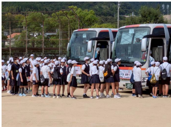
学校観戦用バスの手配