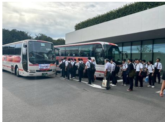
競技会場から宿泊施設へ