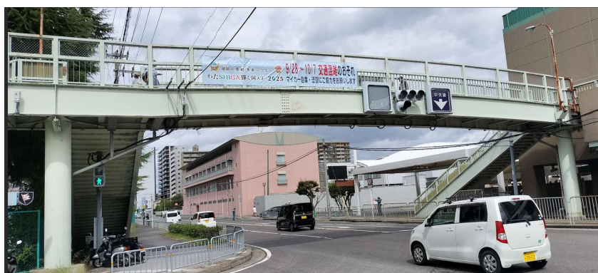
大会期間中のマイカー自粛を呼びかける横断幕