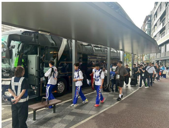
宿泊施設周辺の指定集合地から競技会場へ